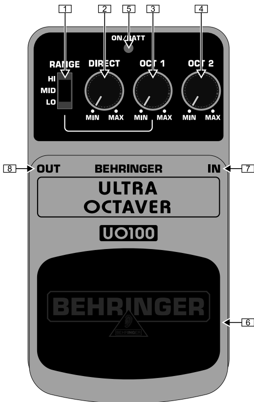
Обзор верхней части